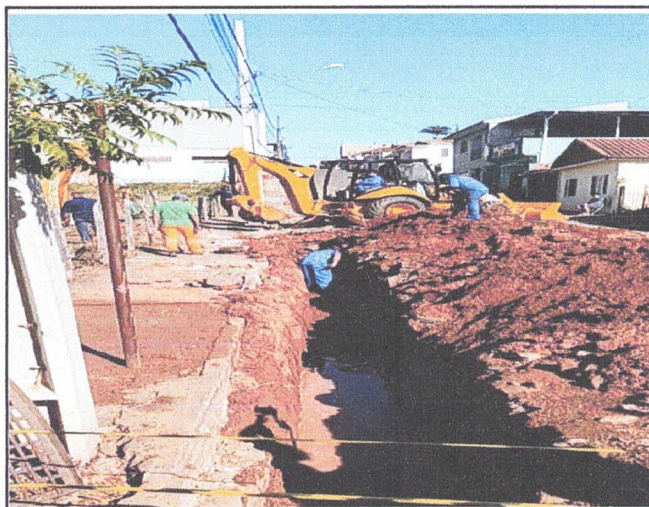
ESCAVAÇÃO DE VALAS