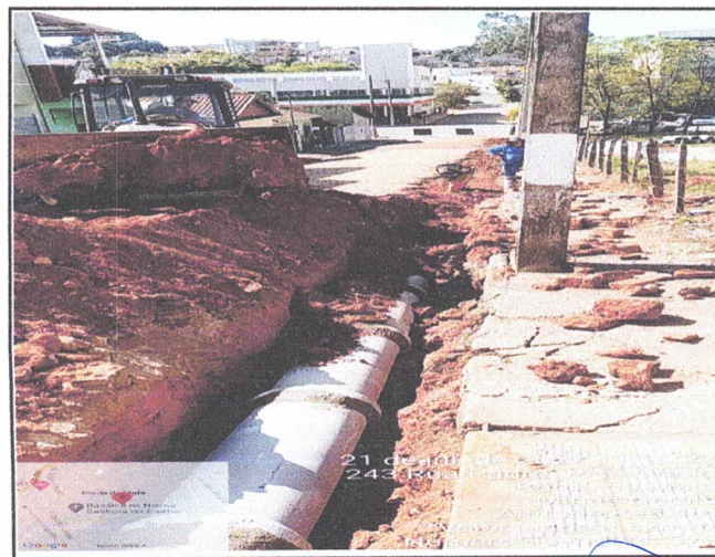
ASSENTAMENTO DE TUBOS