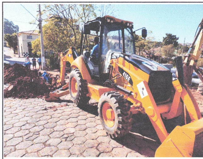
ESCAVAÇÃO DE VALAS