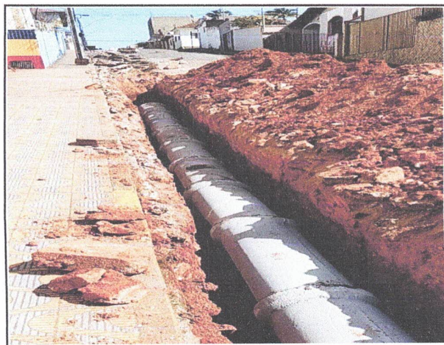
ASSENTAMENTO DE TUBOS