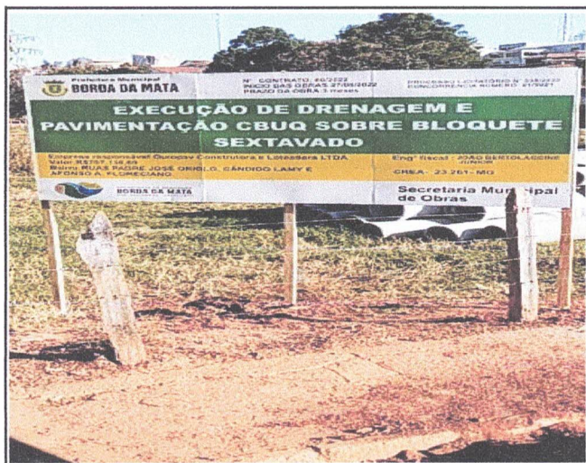
PALCA DE OBRA